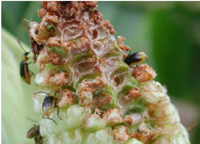
Maiswurzelbohrer: Käfer (Autor