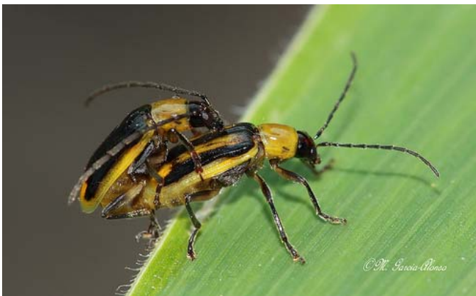
Maiswurzelbohrer: kopulierende Käfer, Bild: Garcia Alonso