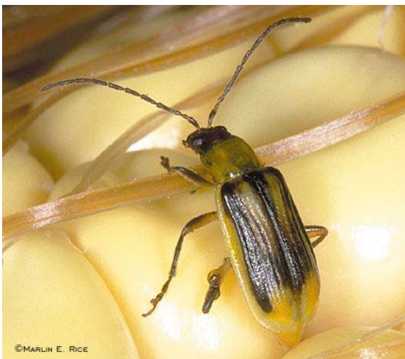
Maiswurzelbohrer: Käfer