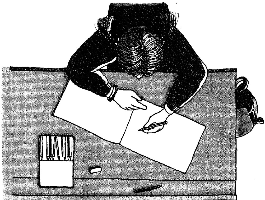
Ausrichtung des Heftes bei Links- und Rechtshändigkeit