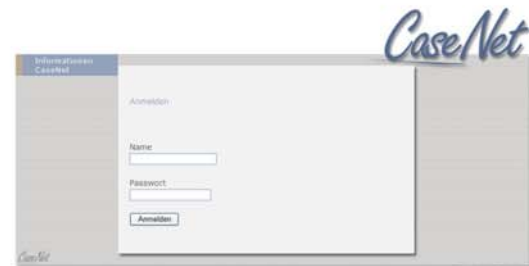
Einstiegsseite https://iiz-sz.casenet.ch .

Auf dieser Webseite geben Sie Ihren Benutzernamen und Ihr Passwort ein. Nach erfolgter Eingabe öffnet sich ein neues Fenster. Hier können Sie den verlangten Zahlencode aus Ihrer Access Card eingeben.