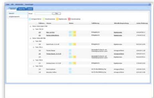
Fallübersicht im CaseNet

Nach erfolgreicher Anmeldung sehen Sie alle Fälle bei denen Sie mitarbeiten oder die Vollmacht haben, Informationen auszutauschen. Klicken Sie auf den Namen der gewünschten Person, um weitere detaillierte Fallinformationen zu erhalten. Falls Sie wiederum auf die Gesamtübersicht Ihrer Fälle gelangen wollen, klicken Sie in der obersten Bildschirmleiste unter dem Menü „Datei“ auf „Übersicht“.