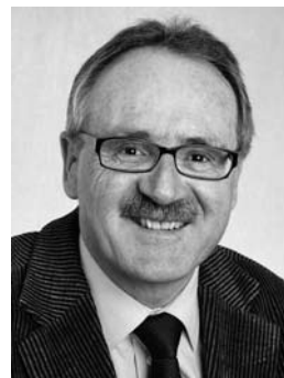
Kurt Zibung Regierungsrat

Nemojte se ustručavati da se obratite nadležnim institucijama ukoliko imate pitanja. Svakako se prvo obratite opštinskoj upravi. Kompetentni centri za integracije KomIn u Goldau i Pfäffikonu, stoje Vam na raspolaganju sa informacijama i savetima na Vašem putu ka integraciji.