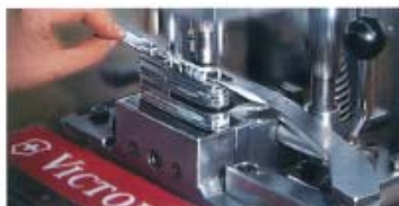
VICTORINOX IN IBACH-SCHWYZ VICTORINOX À IBACH-SCHWYZ