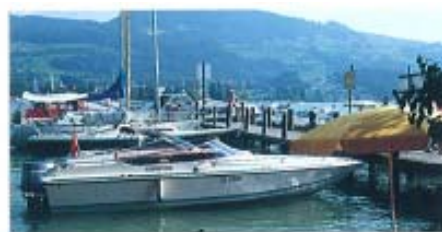
STEG AUF DER INSEL UFNÄU L'EMBARCADÈRE DE L'ÎLE D'UFNAU

Sports nautiques, plages et piscines, tennis, nombreuses possibilités de marches et de promenades, pêche dans la Sihl, expositions au centre culturel Seedamm, casino.