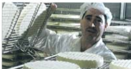
WEICHKÄSEREI BAER LA FROMAGERIE BAER

Ce district aux paysages ravissants qui va jusqu'au Righi Kulm se trouve entre le lac des Quatre-Cantons et le lac de Zoug et présente donc un caractère du plateau et préalpin. L'emplacement au bord du lac