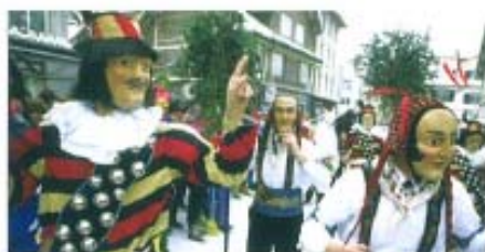
FASNACHTSFIGUREN AUS EINSIEDELN FIGURES DU CARNAVAL D'EINSIEDELN