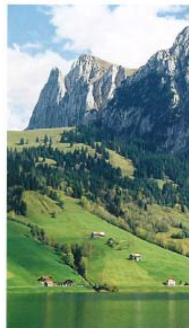
WÄGITALERSEE UND BOCKMATTLI LAC DE WÄGITAL ET LA MONTAGNE BOCKMATTLI

Fasnachtreiben in der ganzen March, Dreikönigen, Siebner Markt im Herbst. Alpbefahrten und Sennenhilbi im Wägital. Aktive Blas- und Ländlermusikszene.