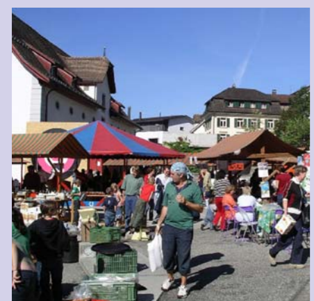
Hofmatt: Im Zentrum von Schwyz wird eine weitere Belegung angestrebt.