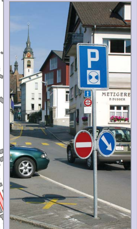
Sonnenplätzli: Die nüchterne Kreuzung soll aufgewertet werden. Vorgeschlagen wird die Integration in die Tempo-30-Zone oder in die Begegnungszone.