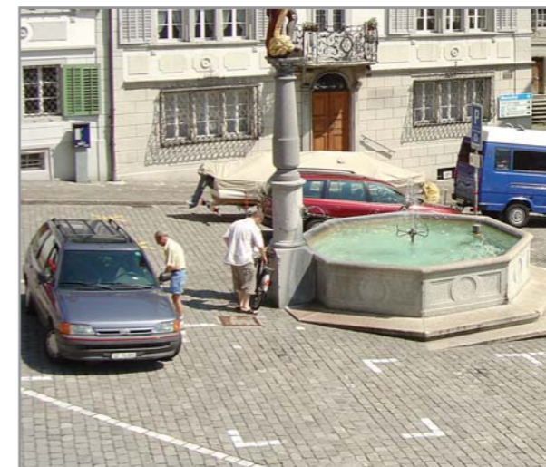
Eine der 34 vorgeschlagenen Massnahmen: Aufwertung des Hauptplatzes Schwyz durch Installation einer neuen Beleuchtung als Begleitelement, Reduktion der Parkplätze und Einrichtung einer Begegnungszone.

Damit können Strassenflächen verschmälert und Gehbereiche geringfügig verbreitert werden, sodass sich die Sicherheit für Fussgänger und Radfahrer erhöht.