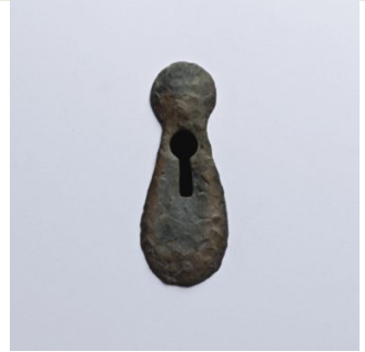
Ugo Rondinone, «dort» Bronze, unbehandelt, 2007, 15.8 x 6.4 cm

Beim Betrachter entsteht eine Vorstellung vom «dort», welche durch die individuelle Betrachtung, Neugierde und Sehnsucht ausgelöst wird und in dessen Fantasie verbleibt.