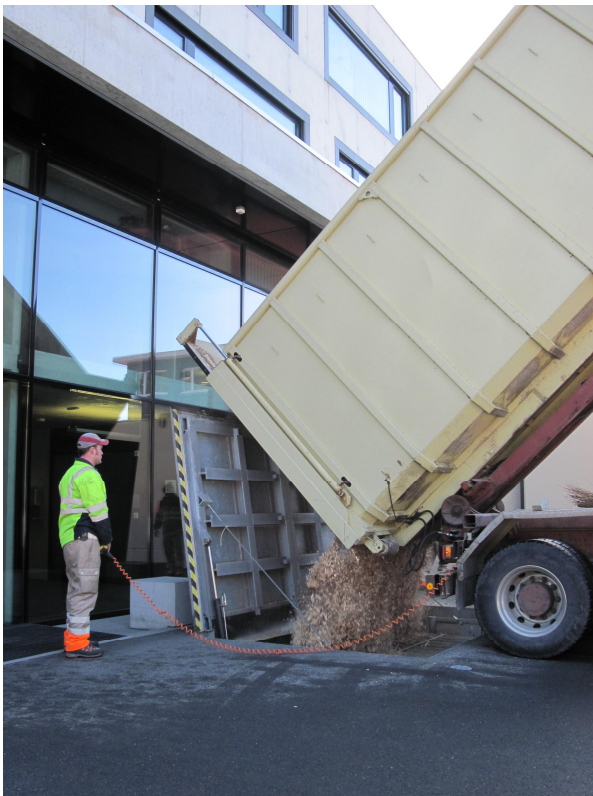
Holzschnitzellieferung Sicherheitsstützpunkt Biberbrugg

Der Anteil der erneuerbaren Energien für kantonale Bauten liegt bereits bei 46%