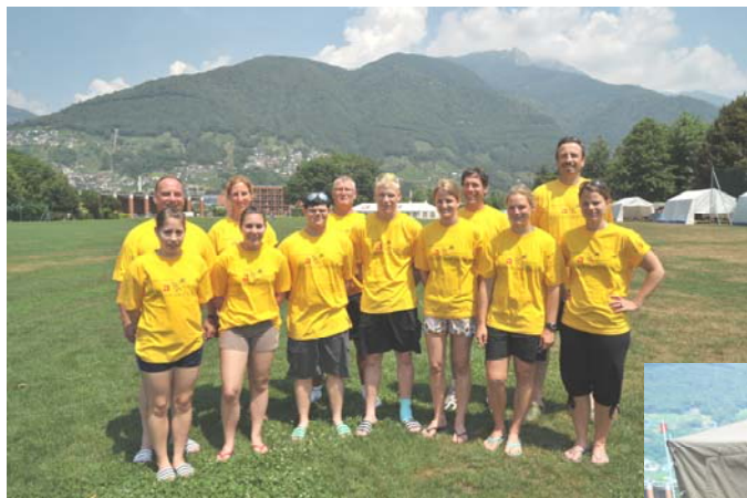
Leiterteam Jubiläumssommerlager Tenero