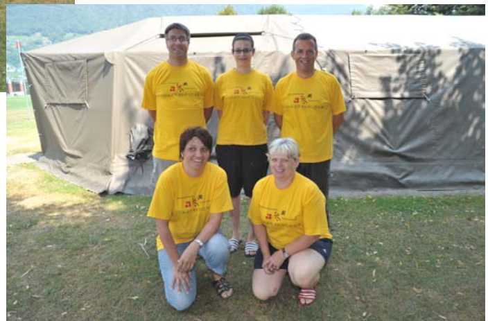
Küchenteam Jubiläumssommerlager Tenero