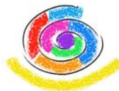
heilpädagogisches zentrum innerschwyz hzi