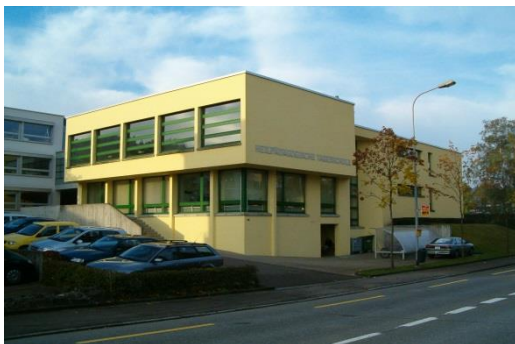
Tagessonderschule des HZ Auszerschwyz