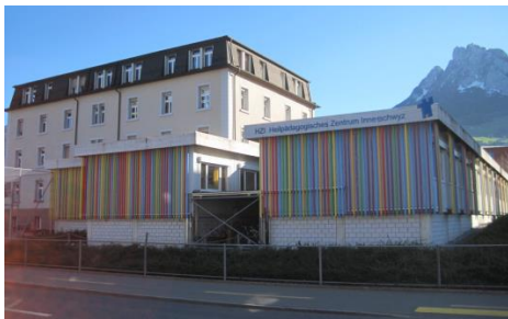
(Heilpädagogisches Zentrum Innerschwyz)

In einer Atmosphäre der Geborgenheit werden sie in ihren individuellen Bedürfnissen, Ressourcen und Fähigkeiten unterstützt und gefördert.