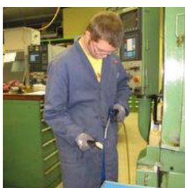
Berufsvorbereitung am HZI

Eltern von Jugendlichen ohne Aussicht auf eine Ausbildung werden frühzeitig auf den Austritt aus der Tagesschule vorbereitet und bei der Suche nach einer Erwachseneninstitution begleitet. Ab dem 18. Altersjahr kann für diese Jugendlichen eine IV-Rente beantragt werden. In pädagogisch begründeten Ausnahmefällen kann eine Sonderschulung maximal bis zum erfüllten 20. Altersjahr verlängert werden. An den Tagesschulen der HZ heisst das bis maximal Ende des Schuljahres, in dem der 19. Geburtstag erreicht wird.