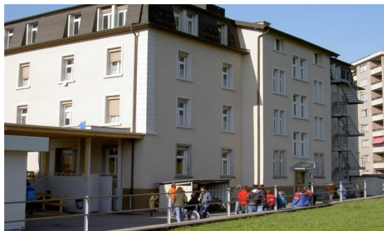
Tagessonderschule des HZ Innerschwyz