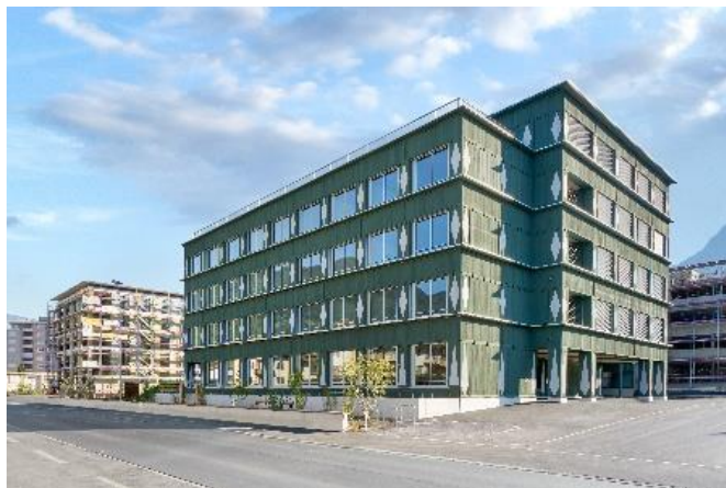
Tagesschule des HZ Innerschwyz