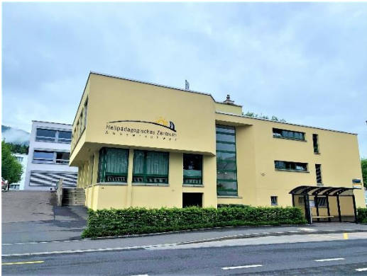
Tagessonderschule des HZ Ausserschwyz