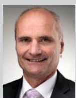
Regierungsrat Ueli Amstad Vorsteher der Landwirtschafts- und Umweltdirektion des Kantons Nidwalden

Welches sind die Gründe für die Verdichtung von landwirt- schaftlichen Böden? Und was misst ein Tensiometer? Lesen Sie dazu mehr in diesem Newsletter.