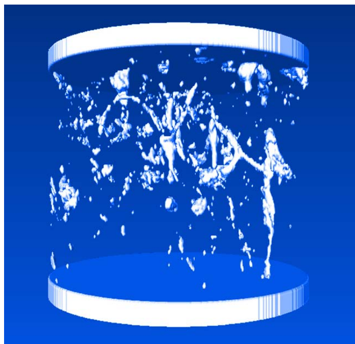
Mittels Computertomograph sichtbar gemachte Grobporen. Gesunder Boden (links) und verdichteter Boden (rechts).