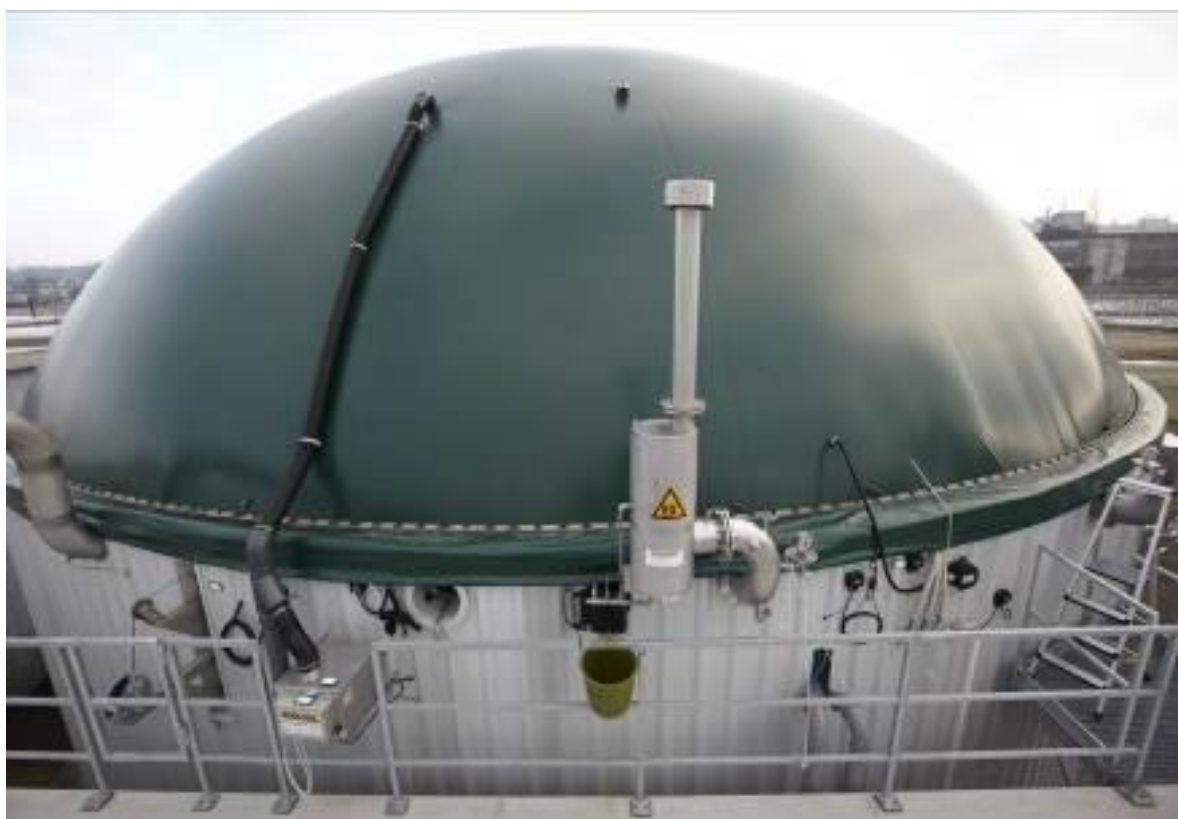
Abbildung 6 Vergärungsanlage