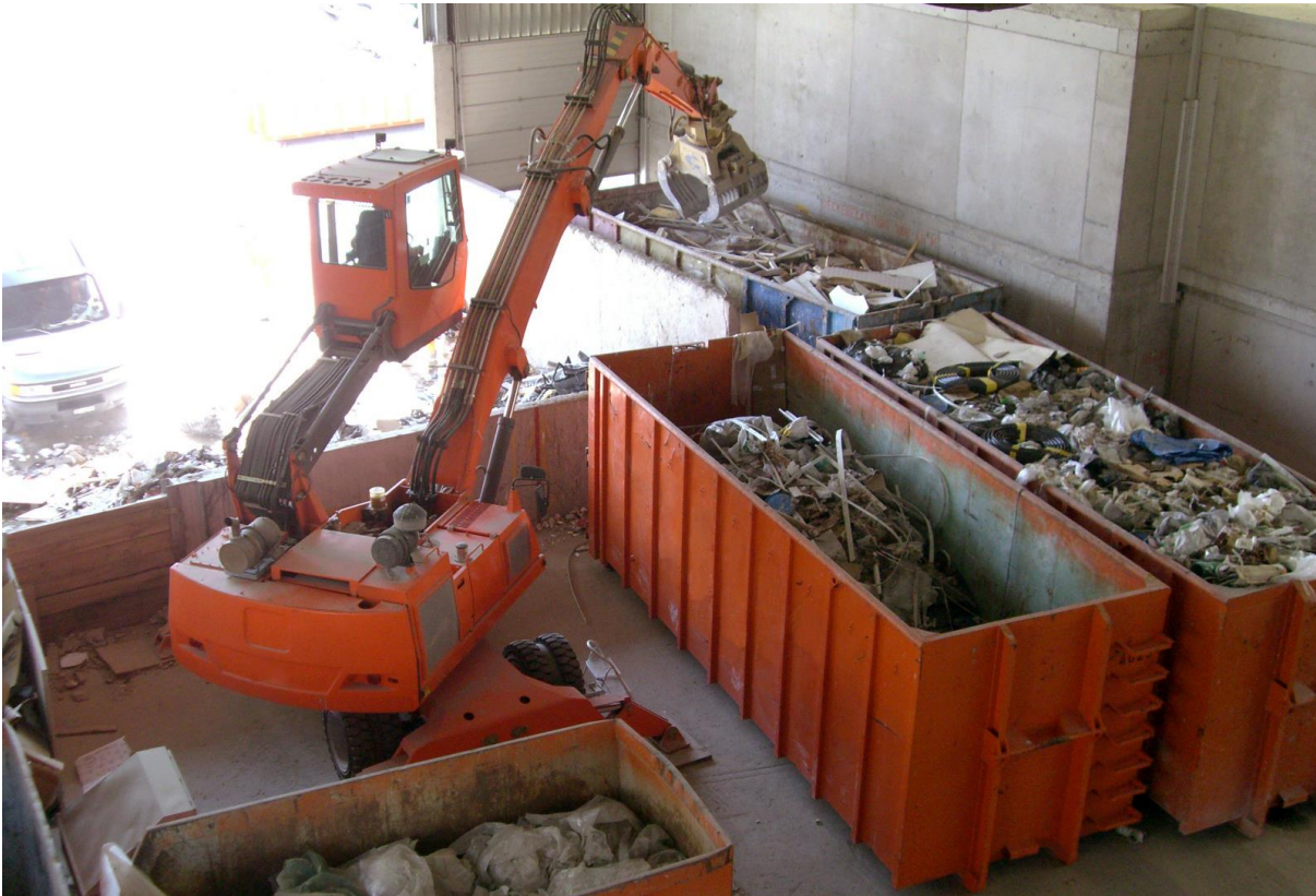
Abbildung 7 Sortierung von Bausperrgut