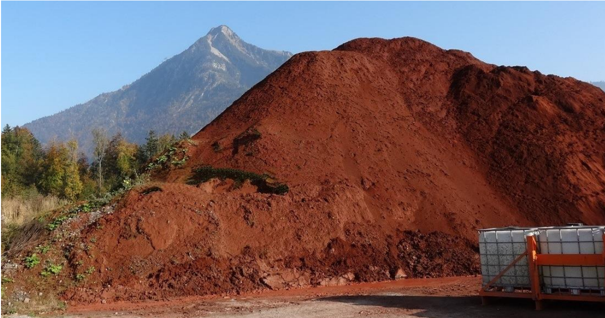
Abbildung 5 Zwischenlagerung von Klärslammasche auf der Deponie Cholwald