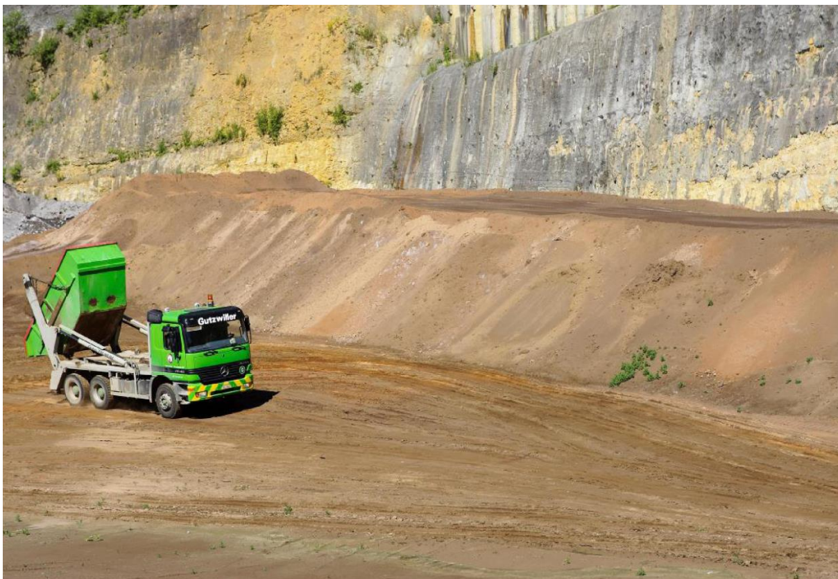
Abbildung 4 Ablagerung von Klärschlammmasche

Tabelle 1 Klärschlammengen in der Planungsregion im Jahr 2009.