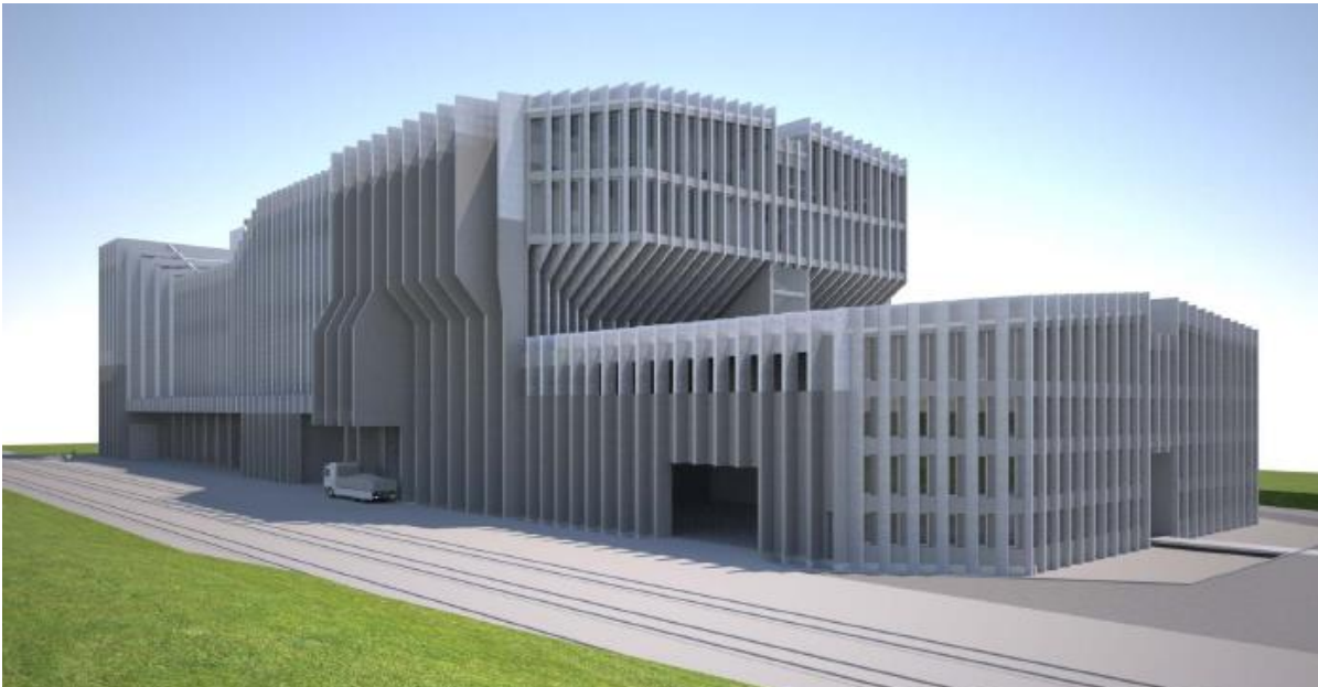
Abbildung 2 Modell der geplanten KVA Renergia, Blick von Südosten (Stand Mai 2011)

Die von den Zentralschweizer Kantonen erhobenen Abfallzahlen stimmen gut mit den Zahlen und Prognosen der Verbände überein. Inklusive Marktkehricht sollen ca. 200'000 Tonnen Kehricht pro Jahr in der KVA Renergia verbrannt werden.