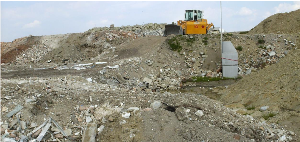
Abbildung 5 Ablagerung von Inertstoffen auf einer Inertstoffdeponie