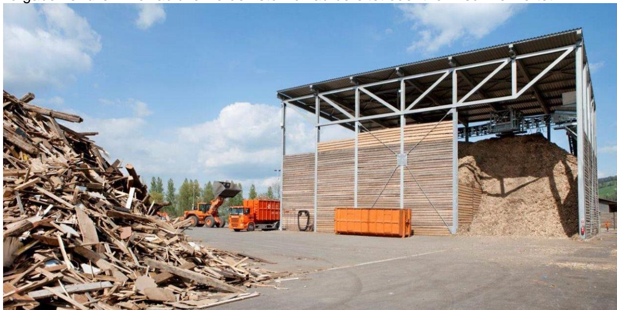
Abbildung 9 Aufbereitungsplatz für Altholz

Holzabfälle gelten gemäss VeVA seit 2006 zum Teil als ak-Abfälle und müssen daher in entsprechend bewilligten Anlagen entsorgt werden. Entsorgungsunternehmen nehmen Holzabfälle von Baustellen sowie aus Gewerbe- und Industriebetrieben entgegen und bereiten sie für die nachfolgenden Entsorgungswege auf. Im Hinblick auf die umweltverträgliche Entsorgung als Sekundärrohstoff müssen die Unternehmen dafür sorgen, dass die Holzabfälle die gesetzlichen Qualitätsvorgaben erfüllen. Holzabfälle werden stofflich aufbereitet oder thermisch verwertet.