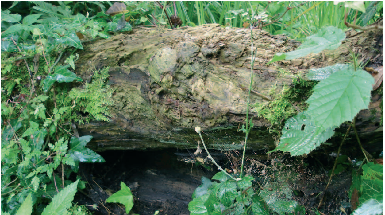
Abb. 1 und 2 Vielfältige Lebensräume