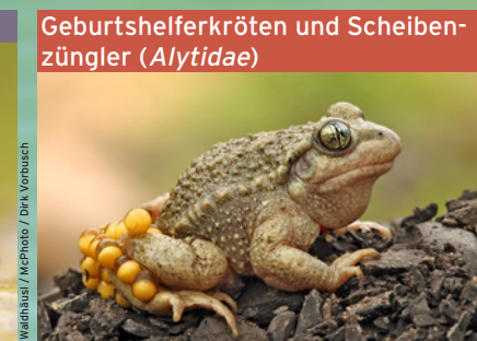
Geburtshelferkröte ( Alytes obstetricans ) EN