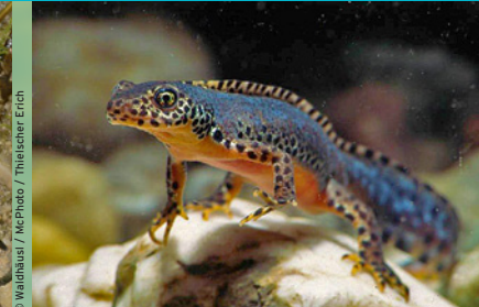
Bergmolch ( Ichthyosaura alpestris ) LC *