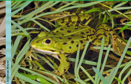
Wasserfrosch ( Pelophylax spec. ) NT *

Gefährdung gemäss Roter Liste der gefährdeten Amphibien der Schweiz aus dem Jahre 2005