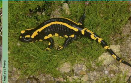
Feuersalamander ( Salamandra salamandra ) VU *