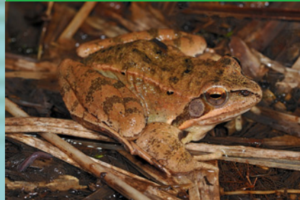
Springfrosch ( Rana dalmatina ) EN