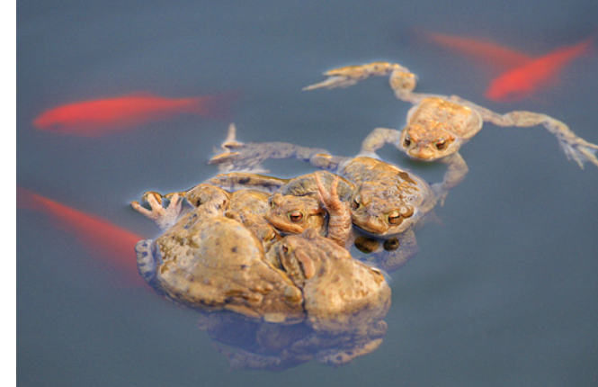
Wer Amphibien fördern will, belässt seinen Gartenteich fischfrei. Denn Goldfische tun sich an Eiern und Larven der Amphibien gütlich.

Ist Ihre Umgebung erst einmal amphibienfreundlich gestaltet, können Sie mit etwas Glück bald die ersten Erdkröten, Grasfrösche oder Bergmolche beobachten. Siedeln Sie jedoch keine Amphibien in Ihren Garten um. Das ist gesetzlich verboten. Ist ein Standort geeignet, wandern die Tiere früher oder später von allein ein. Haben Sie Geduld!