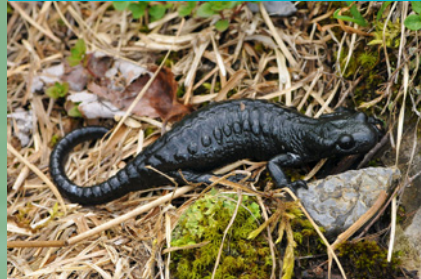
Alpensalamander ( Salamandra atra ) LC