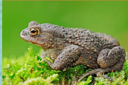
Erdkröte ( Bufo bufo ) VU *