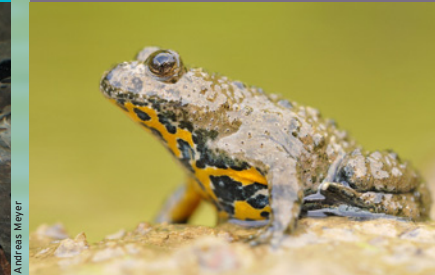
Gelbbauchunke ( Bombina variegata ) EN