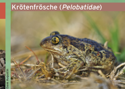
Knoblauchkröte ( Pelobates fuscus ) DD