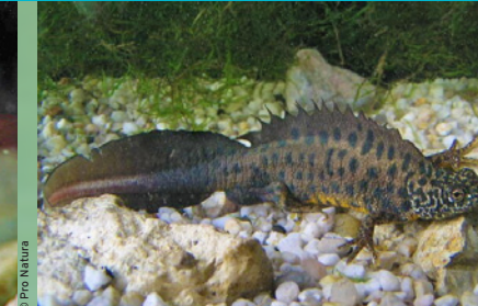
Italienischer Kammolch ( Triturus carnifex ) EN