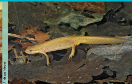
Teichmolch ( Lissotriton vulgaris ) EN