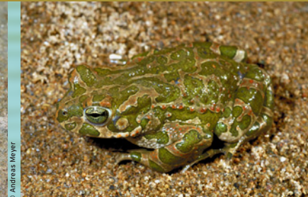
Wechselkröte ( Bufo viridis ) RE