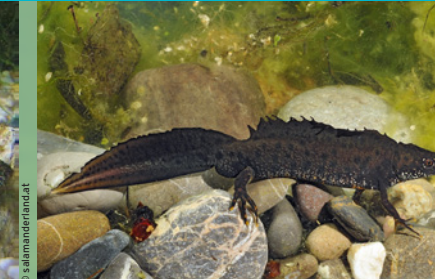
Kammolch ( Triturus cristatus ) EN