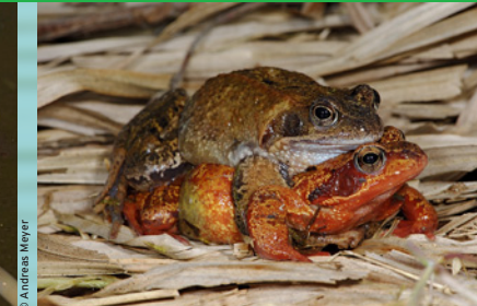
Grasfrosch ( Rana temporaria ) LC *