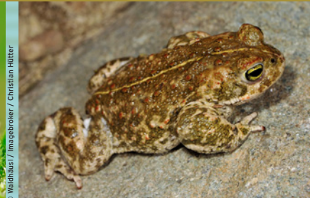
Kreuzkröte ( Bufo calamita ) EN