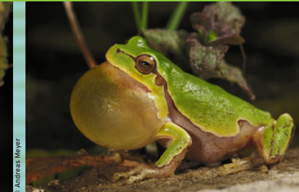
Italienischer Laubfrosch ( Hyla intermedia ) EN