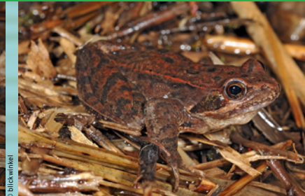
Italienischer Springfrosch ( Rana latastei ) VU