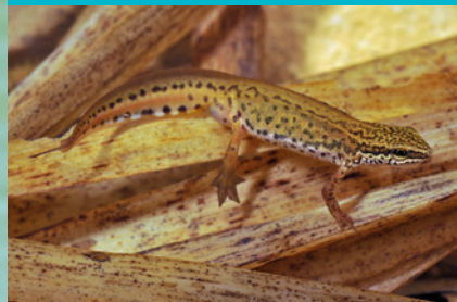
Fadenmolch ( Lissotriton helveticus ) VU