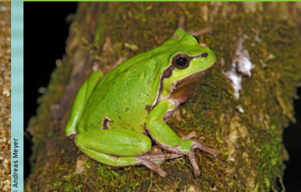
Europäischer Laubfrosch ( Hyla arborea ) EN