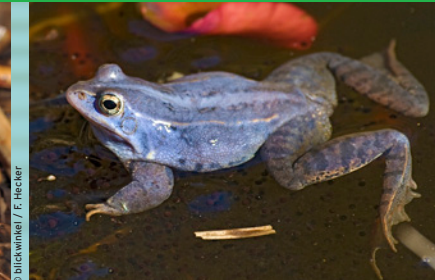
Moorfrosch ( Rana arvalis ) DD