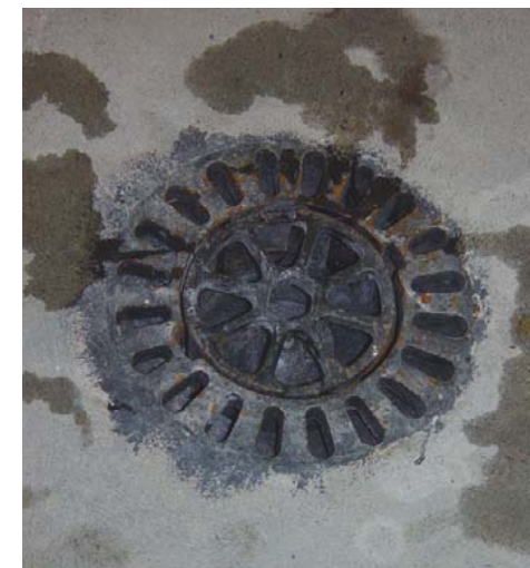
Einsatz: Wasserabfluss geschlossen