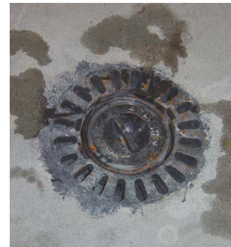
Einsatz: Wasserabfluss offen