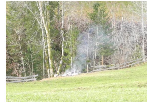
Korrekt betriebenes Grünabfallfeuer mit Bewilligung

i Inversionsprognose Nov.-März unter: www.inluft.ch Waldbrandgefahr unter: www.waldbrandgefahr.ch