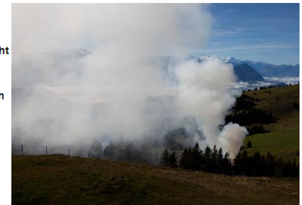
Inversionslage und zu geringe Verbrennungstemperatur (zu nasses Holz)