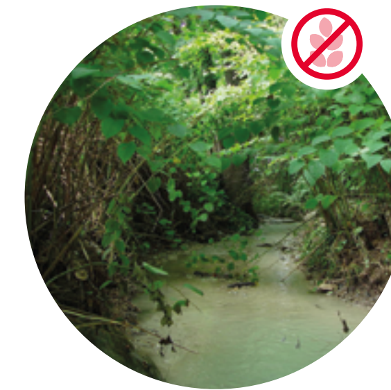
Asiatischer Staudenknöterich verdrängt Vegetation am Bach.

Helfen Sie mit und entfernen Sie exotische Problempflanzen aus Ihrem Garten, damit sich diese nicht unkontrolliert in die Nachbarschaft und in natürliche Lebensräume ausbreiten.