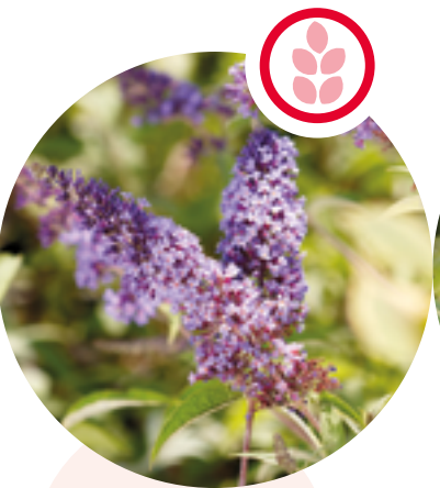
Sommerflieder Buddleja davidii

Herkunft: Nordamerika Blütezeit: Juli bis Oktober