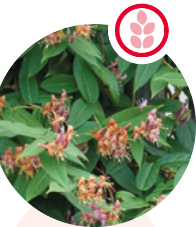
Asiatische Geissblätter Lonicer henryi und japonica

Herkunft: China Blütezeit: Juni bis Juli