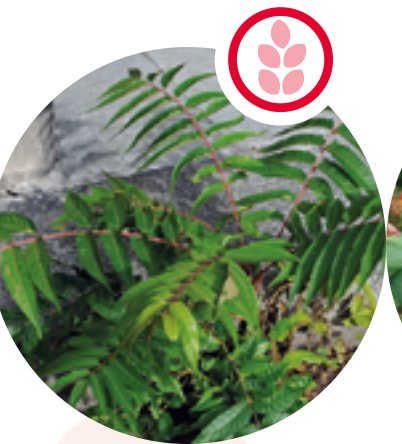
Götterbaum Ailanthus altissima

Herkunft: Nordamerika Blütezeit: Mai bis Juni