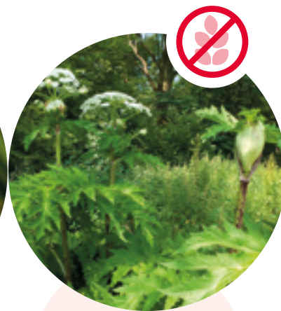
Riesenbärenklau Heracleum mantegazzianum

Herkunft: Himalaja Blütezeit: Juli bis September