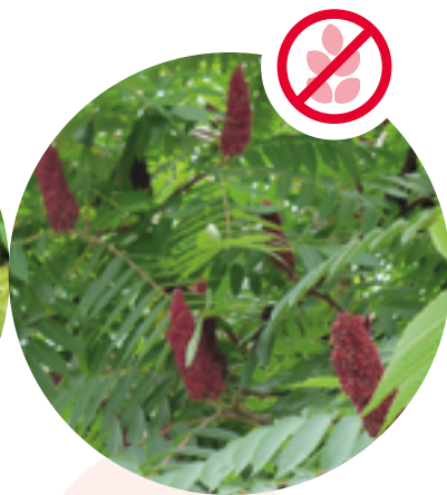
Essigbaum Rhus typhina

Herkunft: Kaukasus Blütezeit: Juli bis September