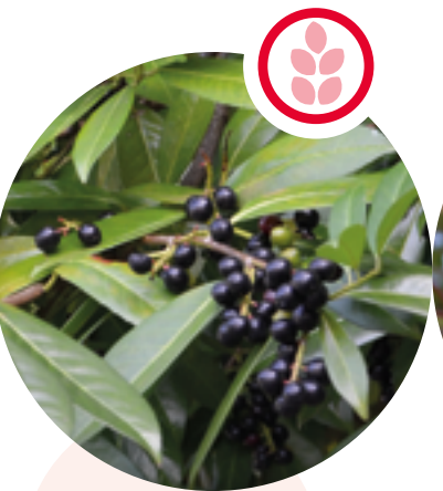
Kirschlorbeer Prunus laurocerasus

Herkunft: China Blütezeit: Juli bis August