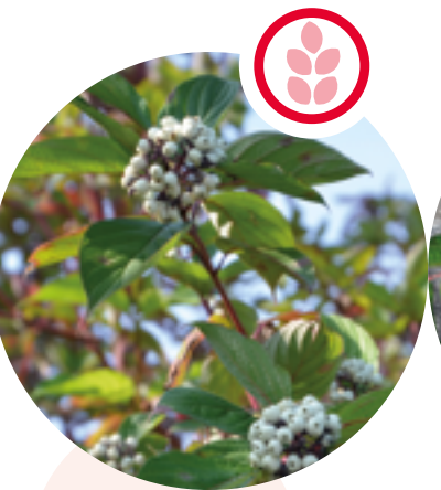
Seidiger Hornstrauch Cornus sericea

Herkunft: Südwestasien Blütezeit: April bis Mai