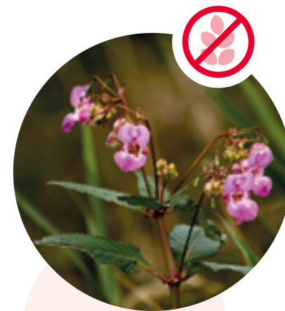
Drüsiges Springkraut Impatiens glandulifera