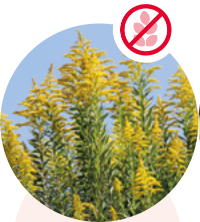
Nordamerikanische Goldruten Solidago canadensis und gigantea

Herkunft: Ostasien Blütezeit: Juli bis September