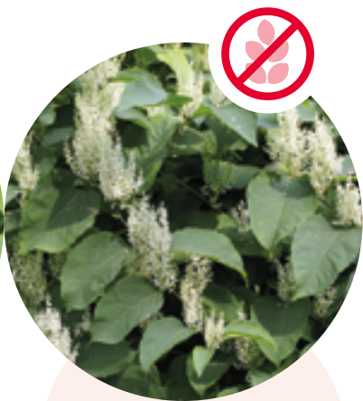
Asiatische Staudenknöteriche Reynoutria japonica, R. sachalinensis etc.

Herkunft: Nordamerika Blütezeit: Mai bis Juni