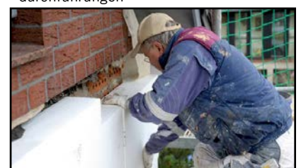
Isolierung der Gebäudehülle