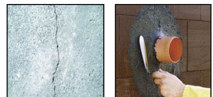
Abdichtung von Rissen und Leitungsdurchführungen