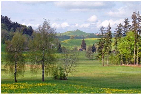
Moränenlandschaft mit vielfältigen Moorbiotopen