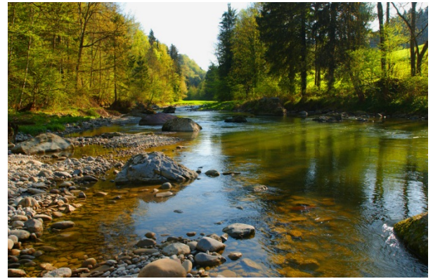
Sihl mit Gesteinsblöcken und Schottern