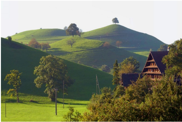
Hügellandschaft bei Menzingen