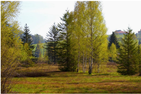
Moorgehölze im Hochmoor Schwantenu