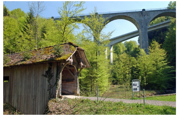
Brücken verschiedener Epochen im Lorzentobel