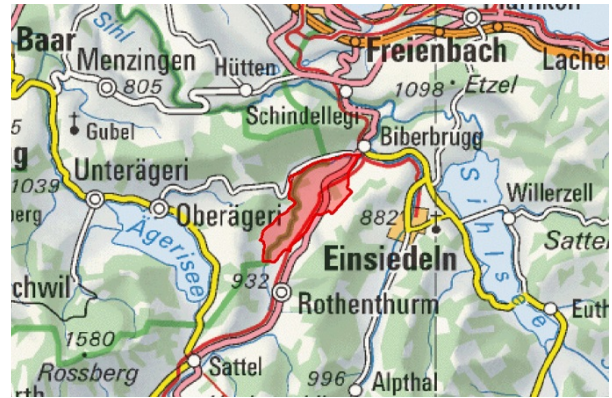
BLN 1308 Moorlandschaft zwischen Rothenthurm und Biberbrugg