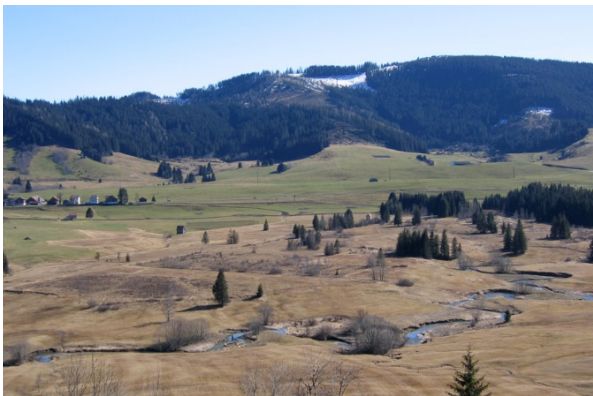
Die Moorlandschaft mit der Dritten Altmatt links