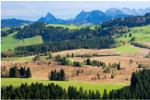
Die ausgedehnte Moorlandschaft nördlich der Dritten Altmatt mit der Höhronenkette im Hintergrund