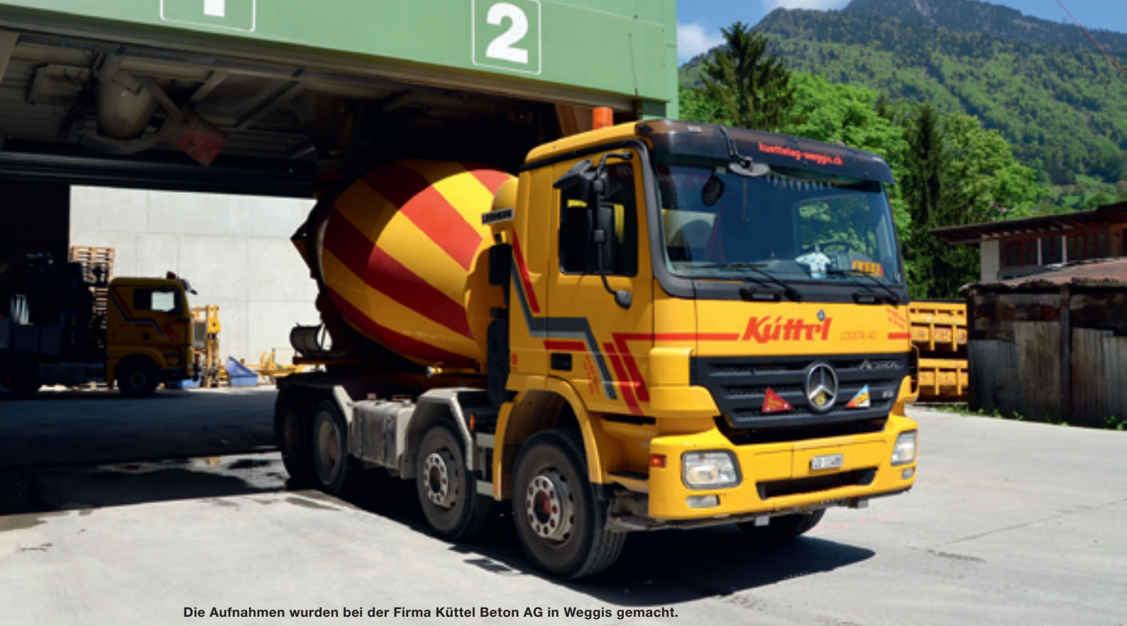
Die Aufnahmen wurden bei der Firma Küttel Beton AG in Weggis gemacht.