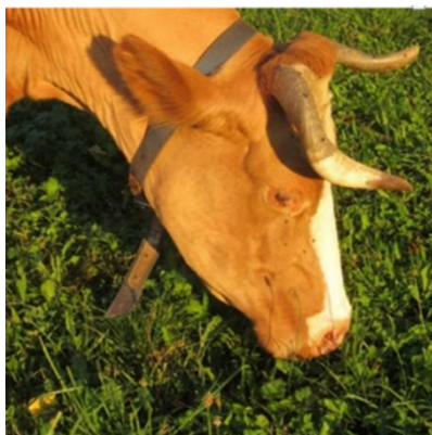
Abbildung 1: Swissfleckvieh-Kuh Berge, die älteste Kuh aus der FiBL-Herde

Die geschlachteten oder verendeten Kühe werden dem Betrieb angerechnet, auf dem die Kuh zuletzt abkalbte. Erfolgte die letzte Abkalbung auf einem Sömmerungs- oder Gemeinschaftsweidebetrieb, so wird die Kuh dem Ganzjahresbetrieb angerechnet, auf dem sie vor der letzten Abkalbung ihren Aufenthalt hatte (Art. 37 Abs. 7 und 8 DZV).