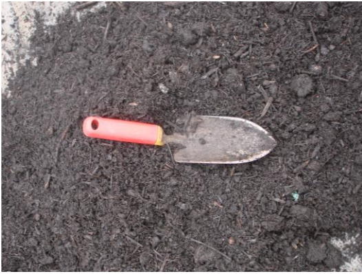
Abbildung 4: Kompost

Kompost ist wertvoll für den Boden und die Landwirtschaft. Neben der Düngewirkung sorgt Kompost für eine ausgewogene Pflanzenernährung, zum Aufbau von Humus und damit zur Verbesserung der Bodenstruktur und dem Wasserhaushalt.