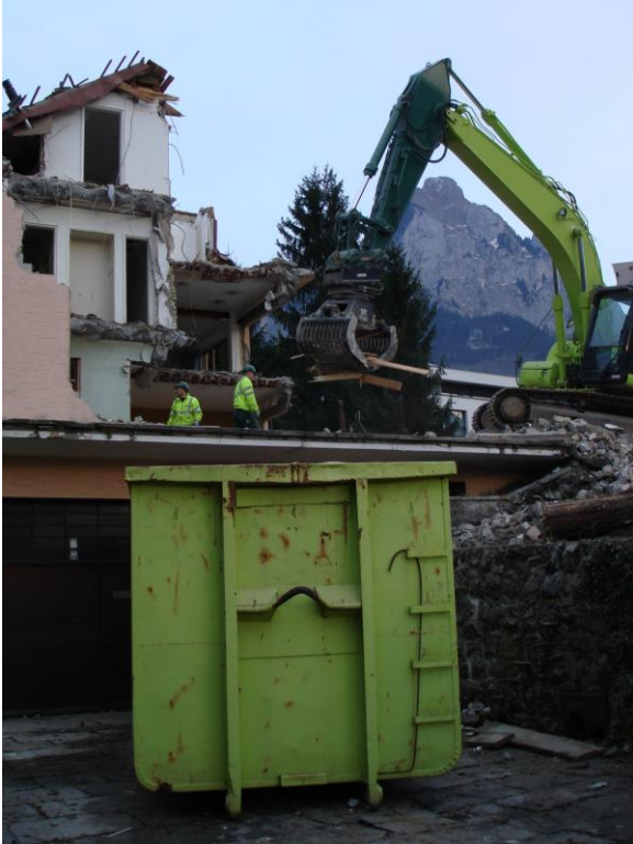
Abbildung 3: Rückbau Gebäude