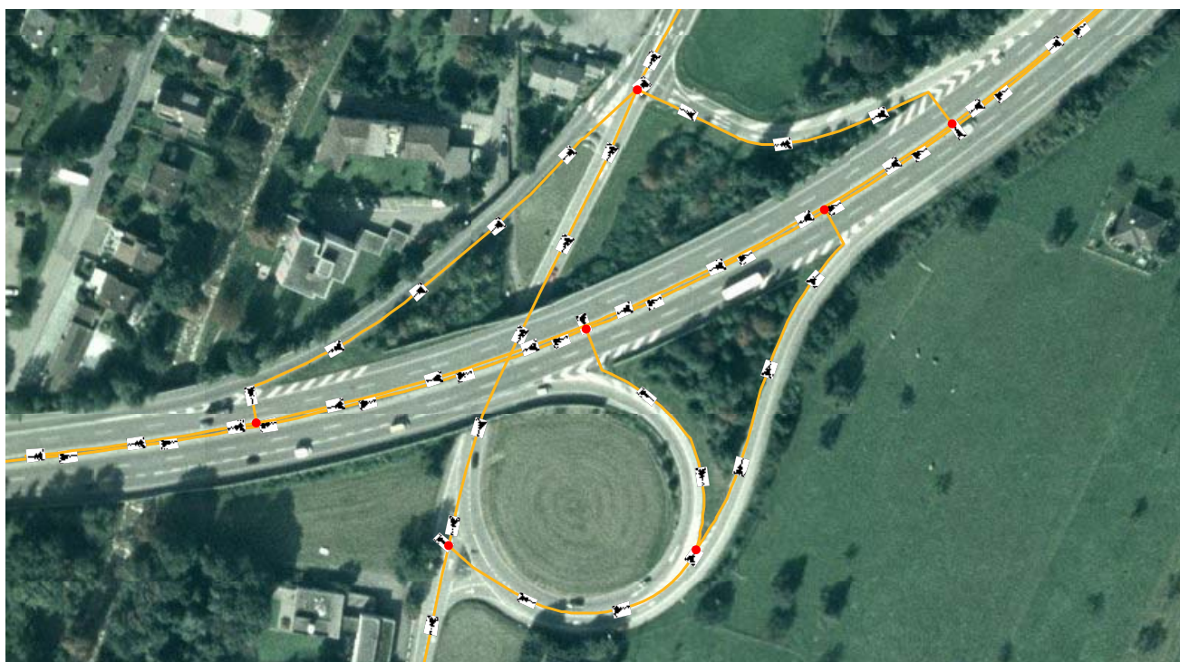
Beispiel Autobahn mit Ein- / Ausfahrt

Die Achsen von Ein- und Ausfahrten werden wie im nachfolgenden Beispiel aufgezeigt definiert. Die Achsen verlaufen in Fahrtrichtung entlang des linken Randes der Ein- bzw. Ausfahrt. Vom Punkt, wo die Ein- bzw. Ausfahrt in die Autobahn einmündet, wird die Achse rechtwinklig auf die Achse der Autobahn definiert. Somit entsteht ein von der Länge der Ein- bzw. Ausfahrtstrecke unabhängiger, klar definierter Knoten. Diese Erfassungsart gilt sinngemäss für Ein- und Ausfahrten bei Rastplätzen.