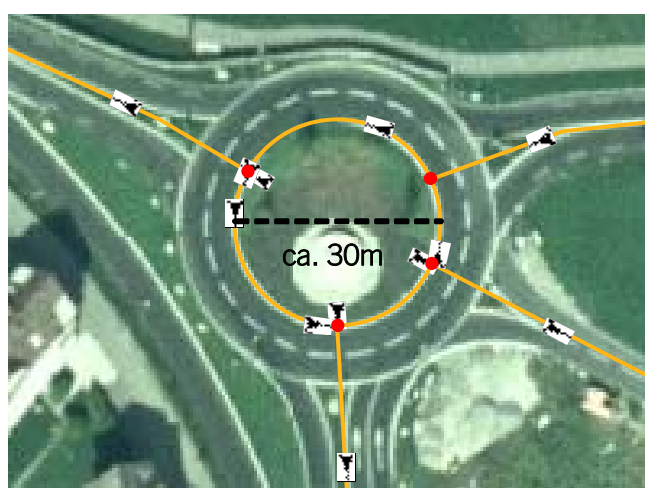
Beispiel grosser Kreisel (ca. 30m)