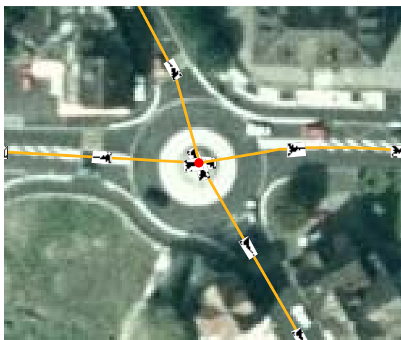
Beispiel normalgrosser Kreisel (ca. 7m)

Bei grossen Kreiseln (Durchmesser Mittelfläche grösser 20m) und speziellen Kreiseln (Mittelfläche nicht kreisförmig) wird am äusseren Rand der Mittelfläche eine zusätzliche Achse in Fahrtrichtung definiert, in welche die Achsen der einmündenden Strassen laufen.