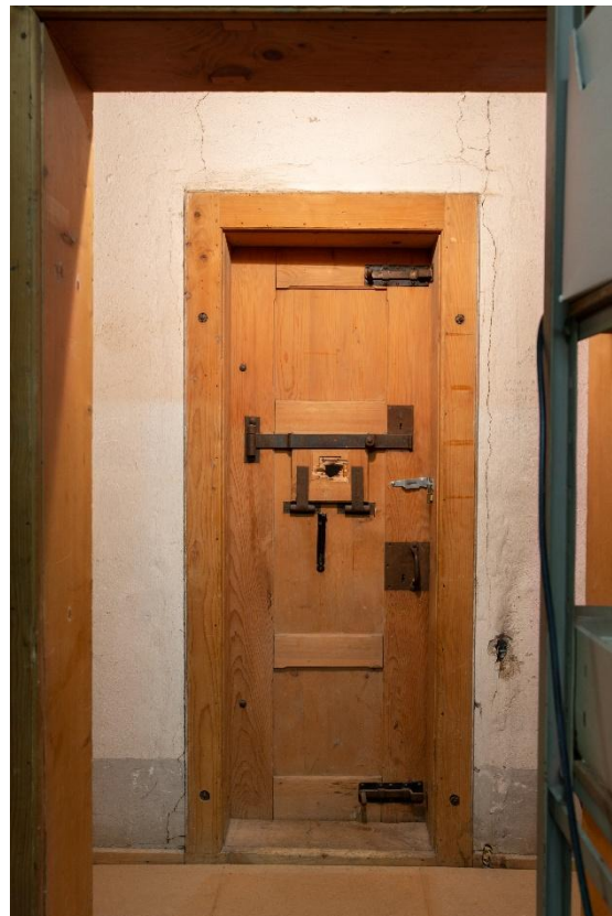
Abbildung 3 Die Arrestzellen im Kaltbach, in denen viele Insassinnen Wandinschriften hinterlassen haben.

Für den administrativen Freiheitsentzug waren strafrechtliche Verfahren oder ein Delikt nicht erforderlich. Allein der Lebenswandel der Betroffenen, welcher die öffentliche Ordnung bedrohte, reichte aus. 17 Die Einweisungspraxis bestand bis in die 1960er-Jahre, denn sogar nachdem das Armengesetz 1965 durch die öffentliche Fürsorge ersetzt wurde, konnten Gemeinden Einweisungen für Arme «zu Unterstützungszwecken» anordnen. Gleichzeitig blieben für die selbstverschuldet Bedürftigen Eigenschaften wie Liederlichkeit, Arbeitsscheue oder Trunksucht weiterhin als Kriterien für Einweisungen bestehen. 18