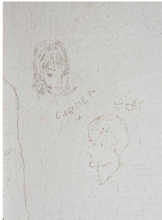
Abbildung 5 Die Beziehungen, aufgrund denen die Betroffenen als "liederlich" galten, fanden ihren Weg in die Arrestzellen.

Partei könne als juristische Person keine Beschwerde im Namen einer bestraften Einzelperson einreichen. Zudem sei der Schutz vor körperlicher Bestrafung lediglich dazu gedacht, «besonders grausame Strafen» zu verhindern, nicht aber Disziplarmassnahmen generell. 38