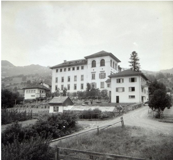
Abbildung 1 Die Zwangsarbeitsanstalt in Seewen bestand rund 70 Jahre. Das Bild zeigt sie im Jahr 1968, kurz bevor sie zum kantonalen Zivilschutzzentrum umfunktioniert wurde.

Er beriet Gemeinden sowie private und öffentliche Institutionen in Internierungsfragen. Gleichzeitig vereinte seine Tätigkeit verschiedene Aufgabenbereiche – von Kontrolle und Fürsorge über die Bekämpfung von Alkoholmissbrauch bis hin zur Präventionsarbeit. Gerade diese Bündelung führte dazu, dass die Fürsorge stark von einem armenpolizeilichen Charakter geprägt war und dadurch erhebliches Konfliktpotenzial entstand. 4 Der Schutzaufsichtsbeamte bewegte sich im Spannungsfeld zwischen tatsächlicher Unterstützung der Betroffenen und der zwanghaften Anpassung an eine bürgerliche Lebensweise. 5