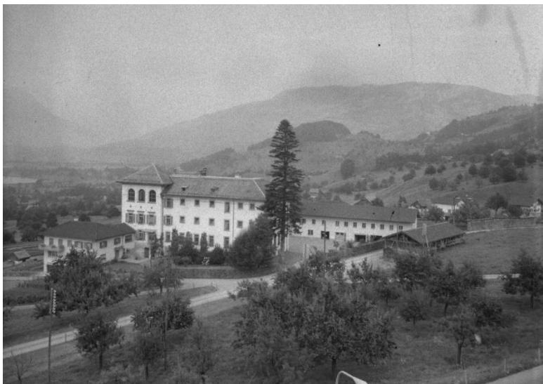
Abbildung 2 In der Zwangsarbeitsanstalt Kaltbach wurden Kriminelle zusammen mit «liederlichen», arbeitsscheuen und trunksüchtigen Menschen interniert.