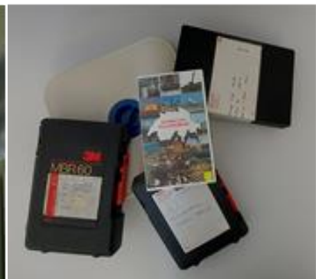
Heterogene Film- und Videobestände aus einer Kulturinstitution.