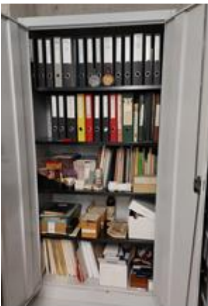
Firmenarchiv (Bild: Staatsarchiv Schwyz).

Eine Traditionsfirma im Kanton (ID 123/8) verfügt über umfangreiche Fotobestände zur Firmengeschichte und bewahrt diese konservatorisch einwandfrei auf. Insbesondere die älteren Bestände sind erschlossen. Das Material wird vor allem zu Werbezwecken und zur Dokumentation der Firmengeschichte verwendet. Eine weitere Traditionsfirma (ID 44/8) bewahrt ihr Foto- und Filmmaterial zur Geschichte der Firma grösstenteils unerschlossen und konservatorisch wenig aufbereitet auf.