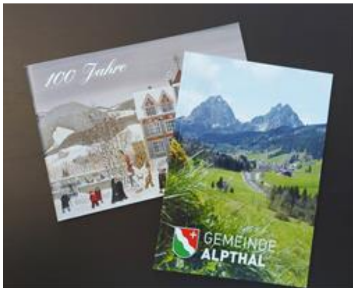
Alpthaler Gemeindegeschichte.

Eine Privatperson (ID 239/8) dokumentiert seit Jahrzehnten den Alpthaler Alltag (z. B. Anlässe, Baustellen, Heuet, Holzverarbeitung, Skilifte) auf Foto und Film. Besonders erwähnenswert ist das Filmmaterial aus den 1960er Jahren zum Skiliftbau Alpthal-Brunni oder zum «Buebeschwinget» im Dorf.