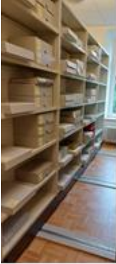
Magazinräume in einer geistlichen Institution.

Eine Traditionsfirma im Kanton (ID 123/8) verfügt über umfangreiche Fotobestände zur Firmengeschichte und bewahrt diese konservatorisch einwandfrei auf. Insbesondere die älteren Bestände sind erschlossen. Das Material wird vor allem zu Werbezwecken und zur Dokumentation der Firmengeschichte verwendet. Eine weitere Traditionsfirma (ID 44/8) bewahrt ihr Foto- und Filmmaterial zur Geschichte der Firma grösstenteils unerschlossen und konservatorisch wenig aufbereitet auf.