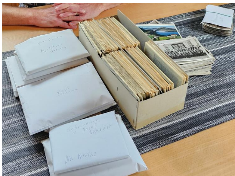
Fotosammlung Nideröst (Bild: Staatsarchiv Schwyz).

Dank einem Zeitungsartikel wurde das Staatsarchiv auf eine bedeutende Fotosammlung aufmerksam. Einer Privatperson in Goldau war die Sammlung des ehemaligen Lehrers und Fotografen Josef Nideröst aus Arth von dessen Nachkommen geschenkt worden. Die Privatperson übergab die Sammlung wiederum dem Staatsarchiv. Nideröst hielt mit seiner Kamera das Leben im Dorf zwischen 1920 und 1950 fest. Dokumentiert sind unter anderem Unwetter, Zeppelinflüge, Schulhausbauten und Zugsunglücke.