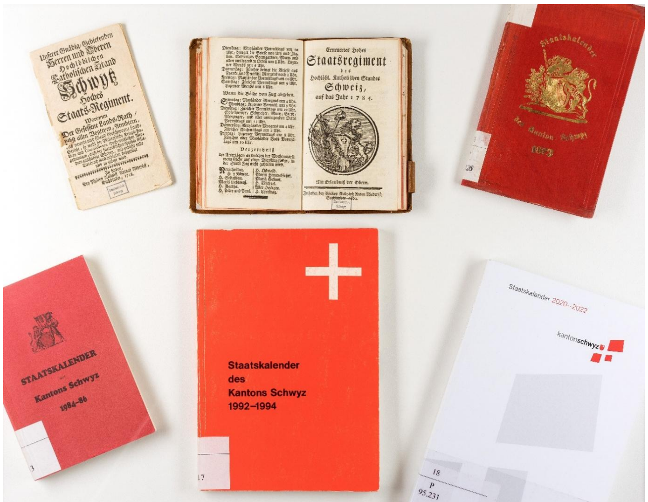
Abbildung 2: Erscheinungsbild und Format der Staatskalender haben sich über die letzten 270 Jahre stark verändert. (Bild: STASZ, SG.CXV.)

enthielt neben dem Kalendarium auch Angaben zu den Jahrmärkten pro Monat. Für die Wochenmärkte in Zug, Luzern und Lachen publizierte er eine Liste der Feiertage, an denen der Markt nicht stattfand. Es folgen Aufzählungen von eidgenössischen Beamten, der «diplomatischen Agenten der Eidgenossenschaft im Auslande», Handelskonsuln und der «hohen» katholischen «Geistlichkeit». Das ausführliche Verzeichnis der Boten und Postdienste für Zug, Altdorf, Schwyz, Unterwalden nid dem Wald und Lachen lässt auf das geplante Verkaufsgebiet des Kalenders schliessen.