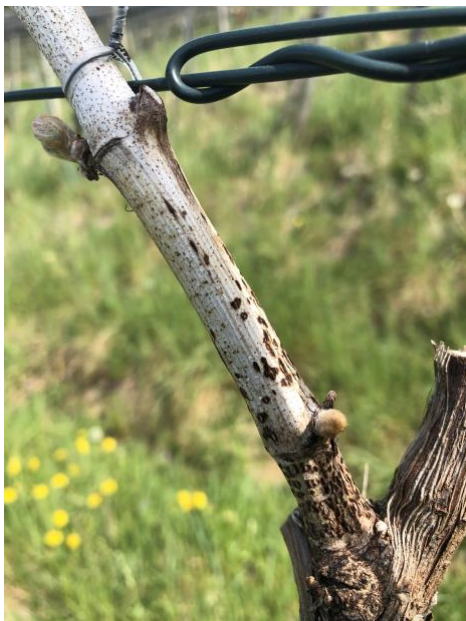
Bild: Ausgebleichtes Holz und schwarze längliche Nekrosen sind typisch für die Schwarzfleckenkrankheit. Bei Niederschlägen kommt es zur Sporenbildung und Infektion der jungen Blätter und Triebe. (M. Göllés)

Bei der Behandlung ist auf eine gute Benetzung der Tragruten und des Stammkopfes zu achten. Beim Einsatz des Sprayers: Luftleistung reduzieren und grosse Düsen bei niedrigem Druck verwenden (Abdriftreduktion).